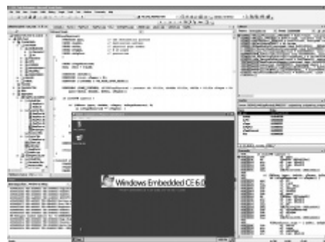
Рис. 2. Отладка в Windows Embedded CE 6.0

Интеграция Platform Builders с Microsoft Visual Studio 2005 обеспечивает доступ разработчикам Windows CE к элементам клиентской части компиляторов. В дополнительный программный модуль для Platform Builder входят элементы серверной части компилятора,