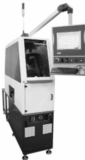
Рис. 1. Роботизированный автомат CIRB500i

Группа Proventia Group концентрирует усилия на исследованиях и разработке автоматизированных производственных линий с использованием универсальных роботов, помогающих повысить эффективность в электронной, металлообрабатывающей промышленности и индустрии композитных материалов. Кроме того, Proventia занимается роботами для фрезеровки и шлифовки при строительстве катеров и яхт, что тоже связано с композитными материалами, а также армированными пластиками. Еще роботы Proventia применяются для шлифовки и отделки самолетных турбин. Данные робототехнические системы имеют ряд преимуществ: